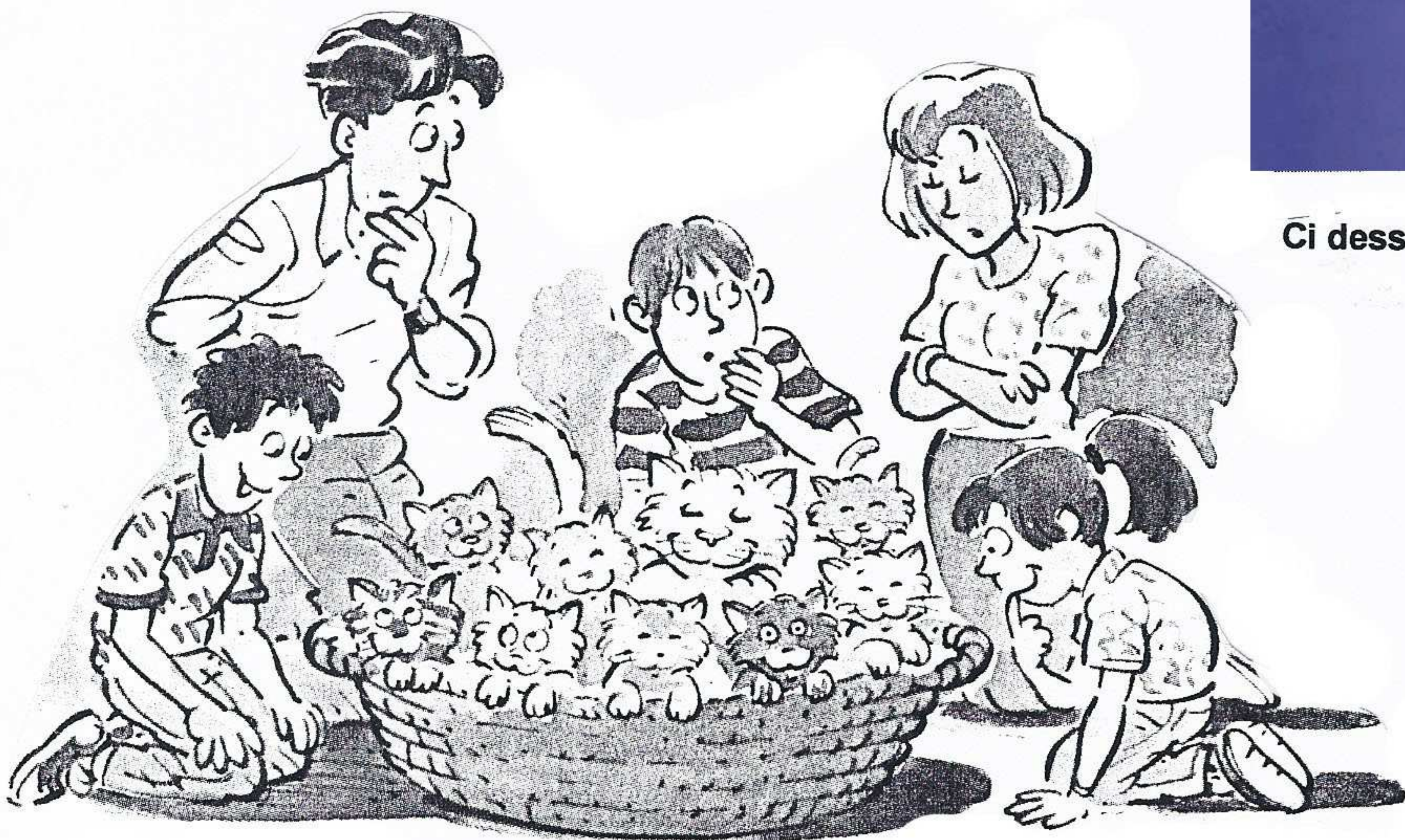
Ci dessus, REAGAN posant pour la photo avec sa casquette d' uniforme ( il op rait habituellement en civil )